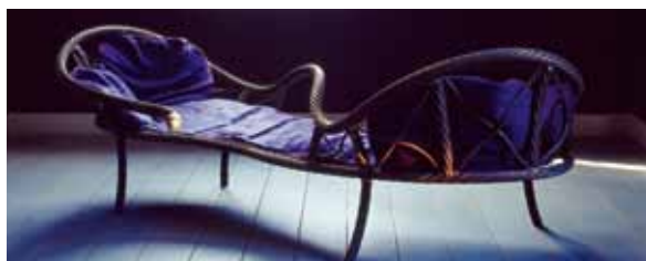
Unika gartensitz – extravaganta schäslonger